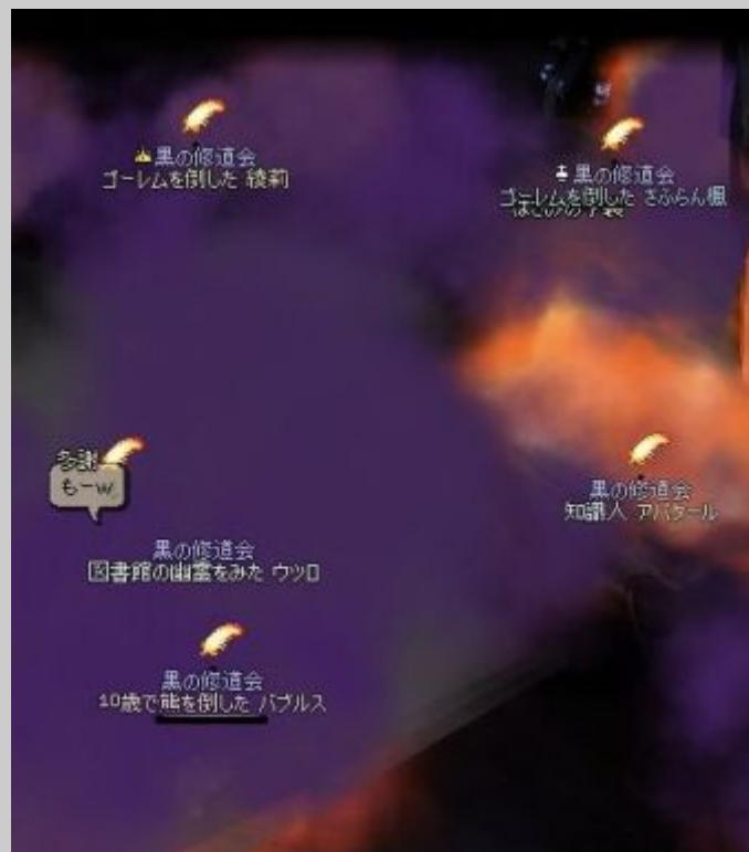
全員爆死(- -;) ナムム 多謝の「もーw」がすべてを語ります