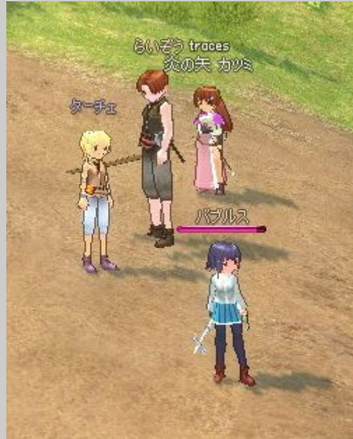
TWからのお付き合い4人組